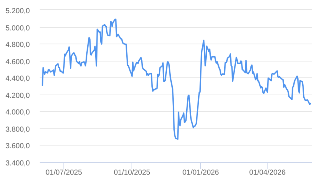
Patrimônio Líquido (R$ Milhões) - 02/06/2025 a 29/05/2026 (diária)