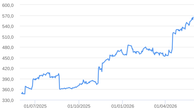
Patrimônio Líquido (R$ Milhões) - 02/06/2025 a 29/05/2026 (diária)