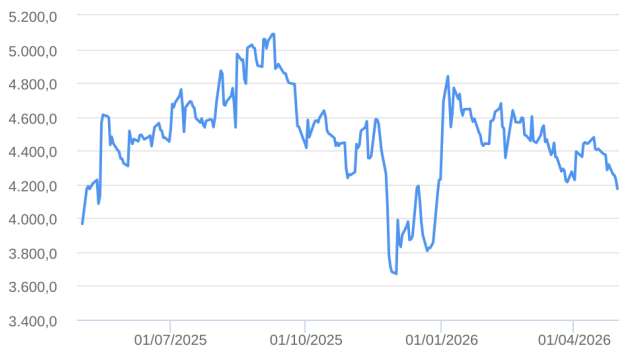
Patrimônio Líquido (R$ Milhões) - 01/05/2025 a 30/04/2026 (diária)