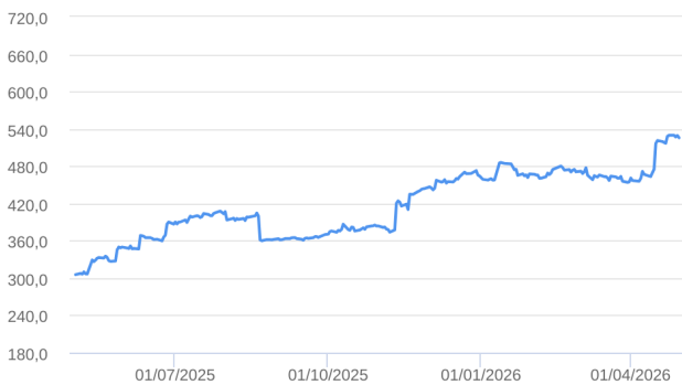
Patrimônio Líquido (R$ Milhões) - 01/05/2025 a 30/04/2026 (diária)