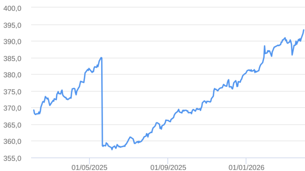
Patrimônio Líquido (R$ Milhões) - 01/02/2025 a 31/03/2026 (diária)